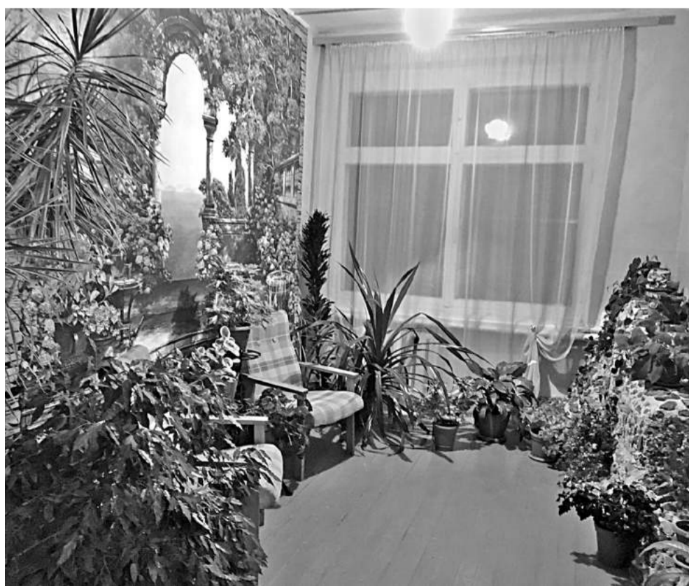
Зимний сад в Васильдольской школе