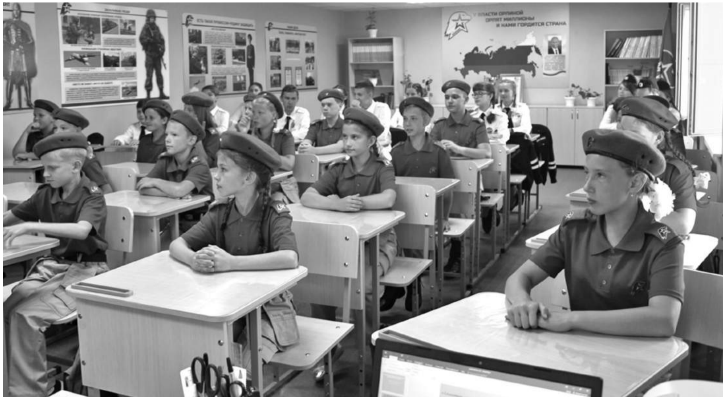
Кадетский класс школы № 1

В результате реализации проекта в школе создали лабораторию, которую можно без преувеличения назвать кузницей пытливых, талантливых юных исследователей. Ученики от четвёртого до выпускного классов занимаются наукой. В рамках постпроектной деятельности рядом с лабораторией оформлена развивающая зона «Химия занимательная и увлекательная», которая рассказывает об опытах,