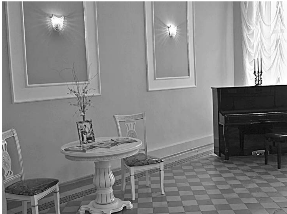
Ольгинский зал школы № 1