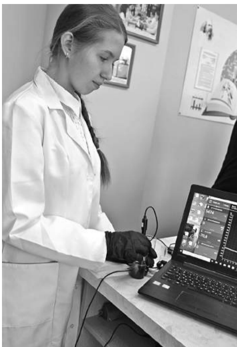
В школе № 1

КОЛЛЕГИ! МЫ ПРИГЛАШАЕМ ВАС СТАТЬ НЕ ТОЛЬКО ЧИТАТЕЛЯМИ, НО И АВТОРАМИ ГАЗЕТЫ!