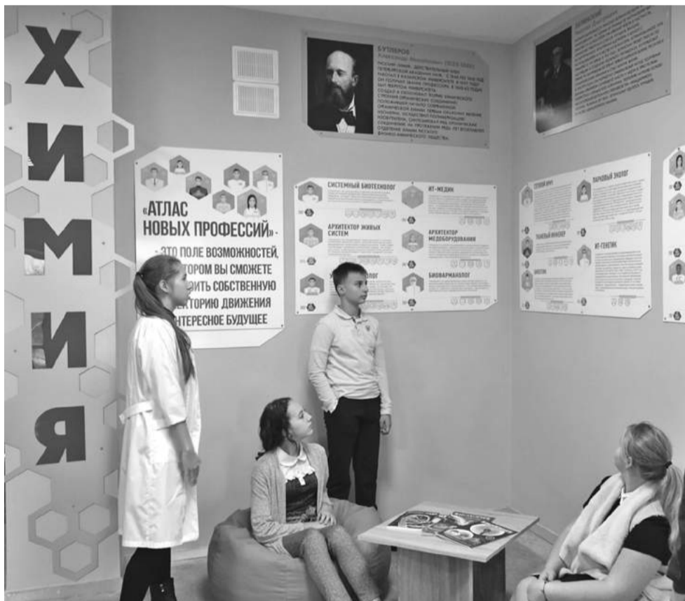
Профориентационная зона в школе № 1