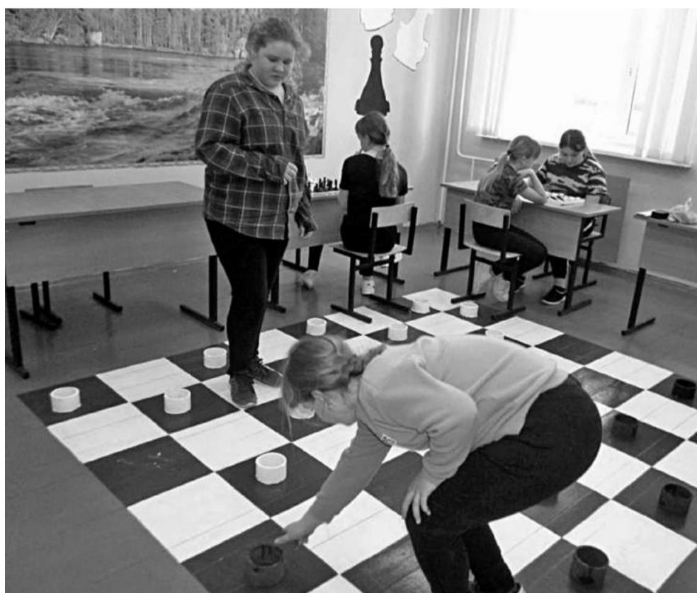
Игровая зона в Глинской школе